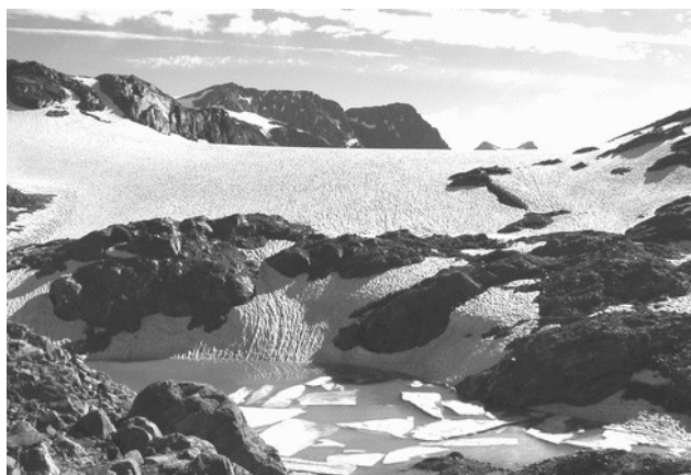
7 settembre 2014