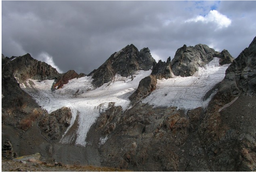
19 Settembre 2015