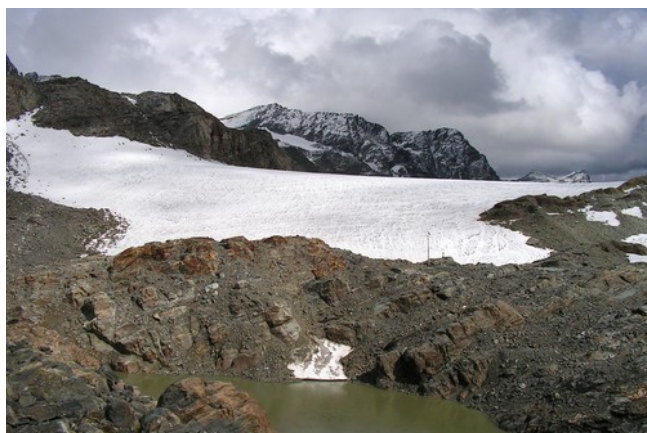
19 settembre 2015