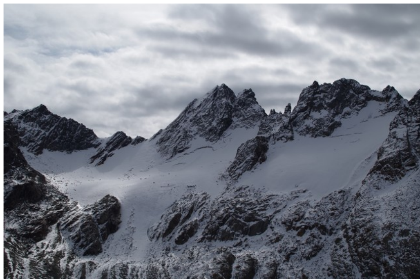
23 settembre 2017