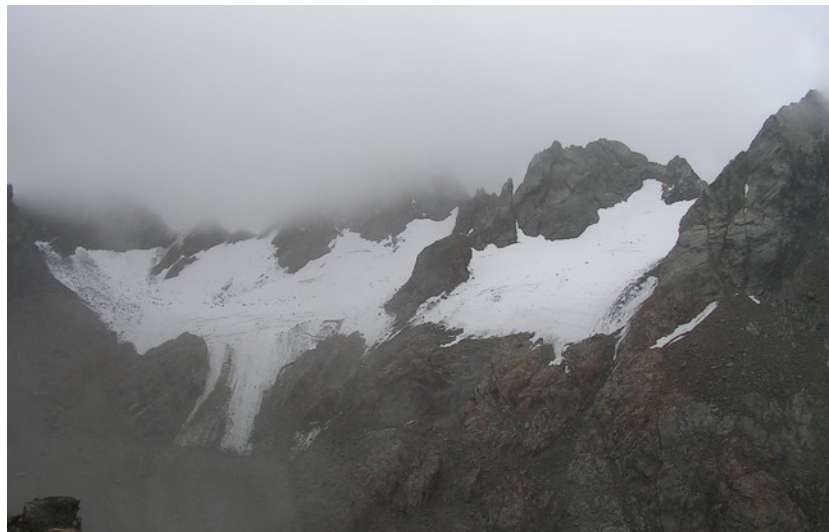
18 settembre 2016