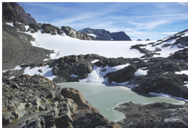
14 settembre 2013