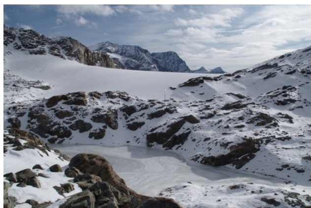
23 settembre 2017