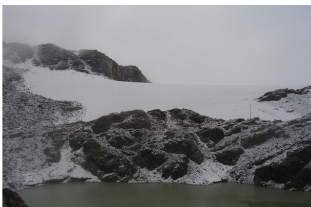
18 settembre 2016